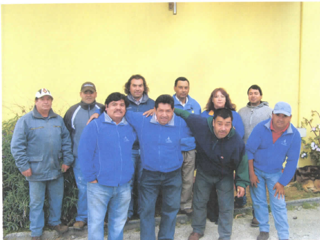
Funcionarios administrativos, inspectores, conductores, operadores.